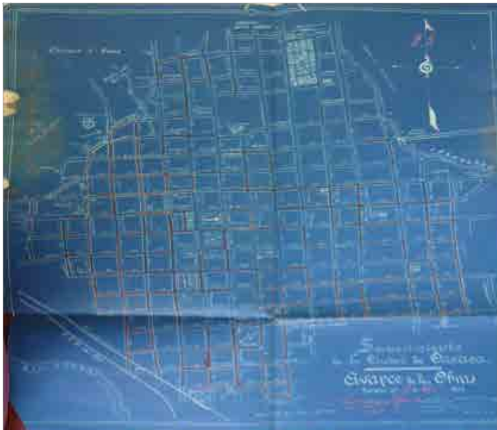
Figura 3. Plano del avance de las obras de saneamiento de la ciudad de Oaxaca, 1912.