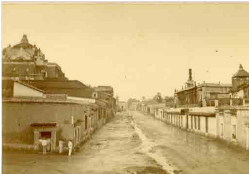
Figura 2. Avenida Independencia, ciudad de Oaxaca 1900.